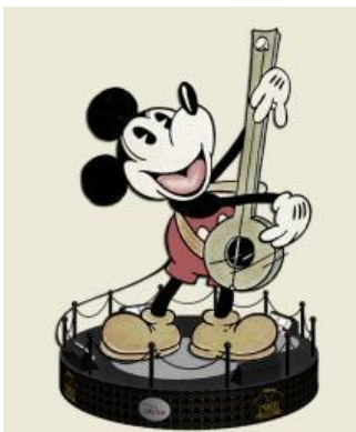
The ONE 露天廣場大型立體裝置