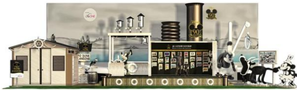
The ONE UG2 中庭大型立體裝置